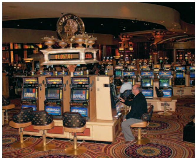
Las Vegas, outre les jeux de hasard, est la Mecque de l'audiovisuel.