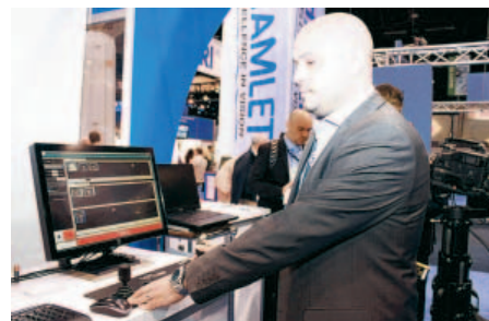
"Vegas, c'est la grand-messe de l'audiovisuel."

Un concert de Céline Dion, un spectacle de Franco Dragone, des casinos par centaines et... Tiens, des Frameriouss! Les responsables de l'entreprise NeuroTV étaient, tout comme I-Movix, en force sur le stand Wallon du NABSHOW de Las Vegas.